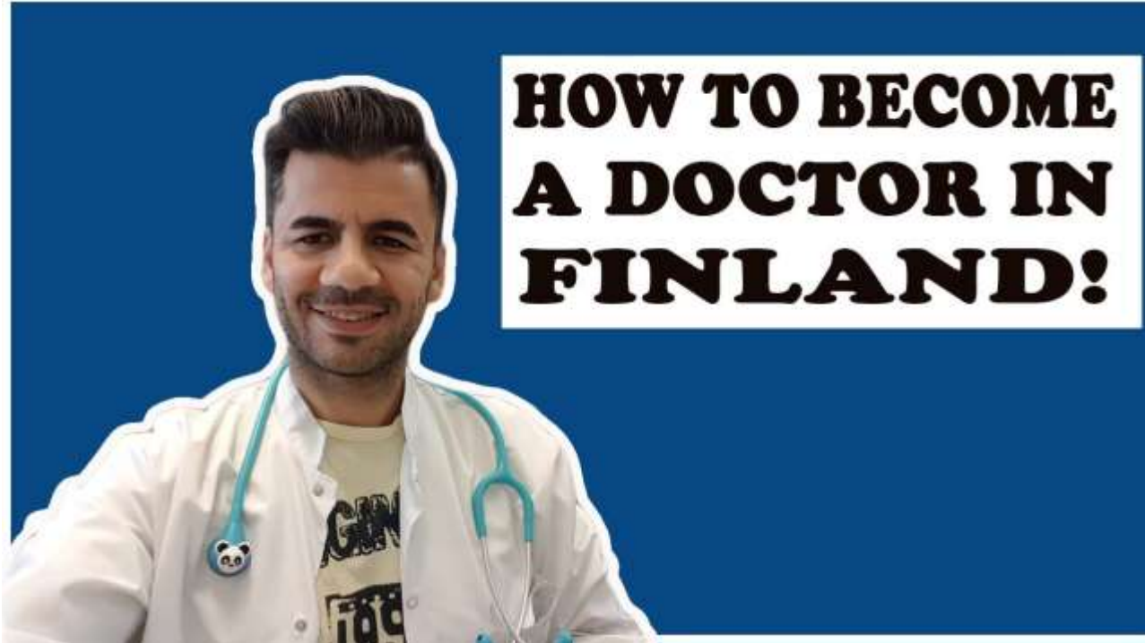
Picture courtesy of https://i.ytimg.com/vi/PDSeiKAM4sE/maxresdefault.jpg